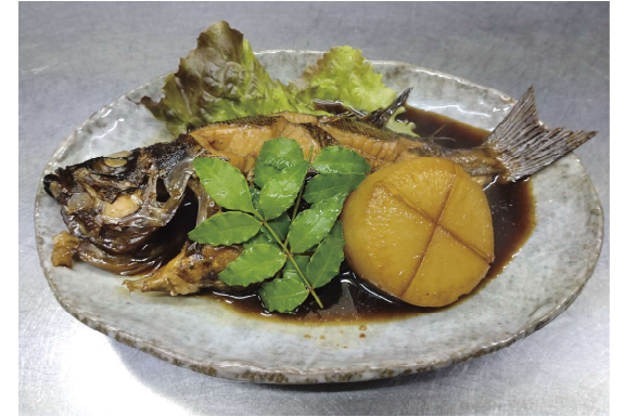
料理 メバルの煮つけ

メバルはウロコをきれいに取り除き、腹の部分を開かずにつぼぬきで取り除いて、萩の醤油を使って煮付けています。 メバルは仕入状況にもよりますが、刺身や塩焼きでも提供しています。