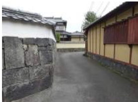
萩市平安古にある鍵曲（かいまがり）

ぶらり歩いてみられませんか？ 御馴染みの風景かもしれません 節、また違う風景が映るかもしれませんね。