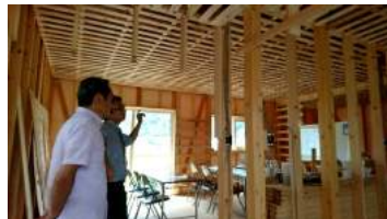
温熱環境や耐震性能はココをチェック