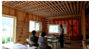
実際の家の構造を見ながらの勉強会なので、とってもわかりやすいです。